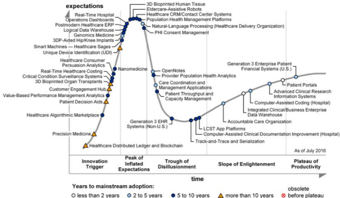
Figure 1. Hype Cycle for Healthcare Providers, 2016